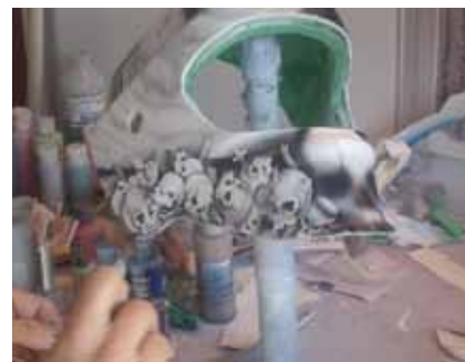
Progression du côté droit