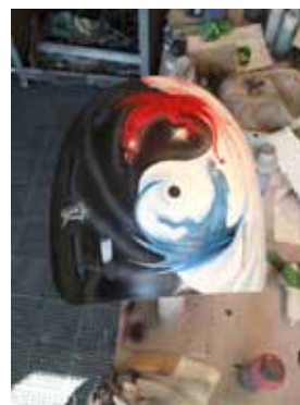
Plaque arrière du masque