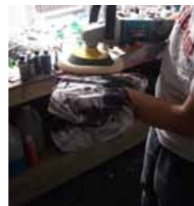
Dernier coup de poliche