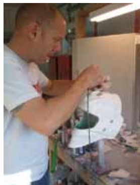
Premiers jets de peinture

Voici quelles photos du masque de Landry étape par étape.