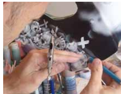
Détails du côté gauche